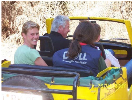
Eine Fahrt mit dem Trabi zur simulierten Gesellschaftsjagd